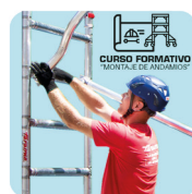
Curso de formación sobre el montaje. Curso de formação sobre montagem.