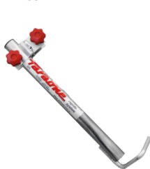
Fijación a pared. Fixação na parede.