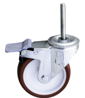
Rueda de 12,5 cm. con freno. Roda de 12,5 cm com travão.