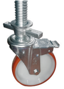
Rueda de 20 cm. con freno y husillo. Roda de 20 cm com travão e fuso.