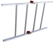
Sistema de pliego. Sistema de dobragem.