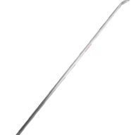
Diagonal base. Diagonal base.