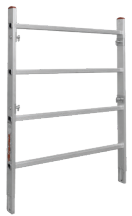
Lateral módulo final. Lateral módulo final.