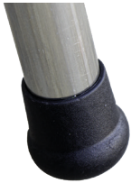
Tapón exterior de 4 cm de diámetro. Tampa exterior com 4 cm de diámetro.