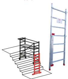
Kit escalinatas. Kit escadarias.