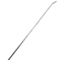
Diagonal base. Diagonal base.