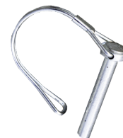
Gancho pasador. Gancho de fecho.