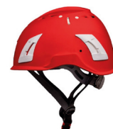
Casco de seguridad. Capacete de segurança.