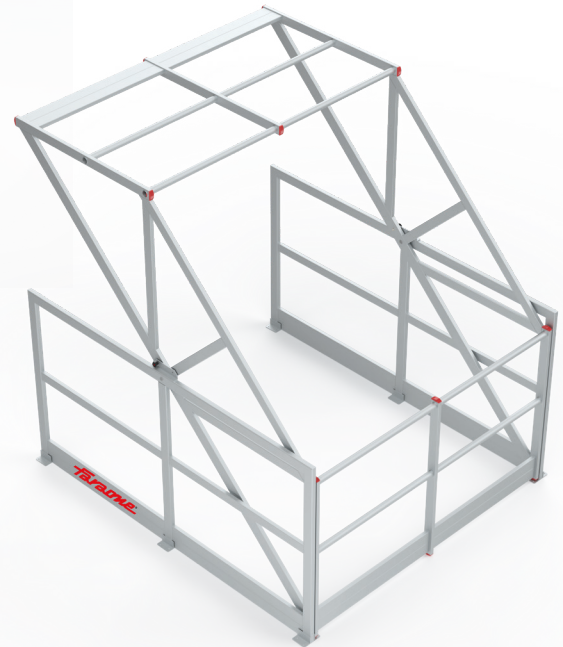
POSICIÓN 1 POSIÇÃO 1